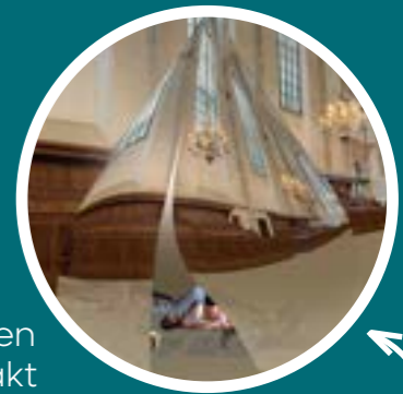
Ontwerp door Buro Belen

Samen met COUP, buro BELÉN en Hylkema Erfgoed maakten we een prijswinnend ontwerp voor de Prijsvraag Sublieme Schoonheid van de Rijksdienst voor het Cultureel Erfgoed en de Rijksbouwmeester. Ons ontwerp gaat uit van flexibele en betaalbare isolatielaag, gemaakt van textiel, om monumenten zoals kerkgebouwen duurzaam te isoleren.