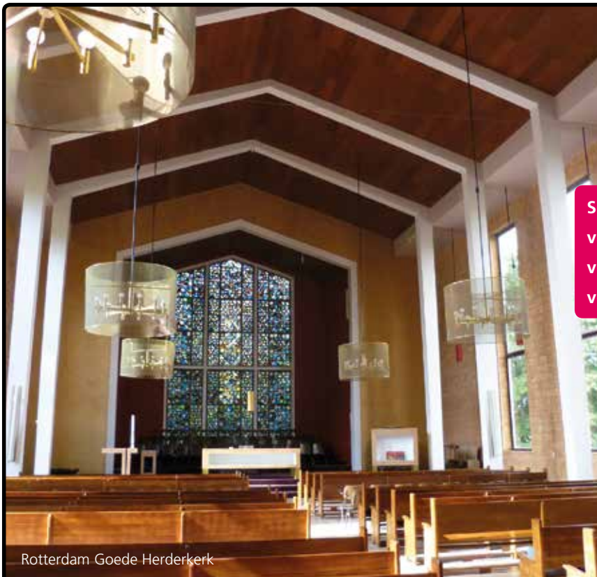
Rotterdam Goede Herderkerk

Een goede verstaanbaarheid in de kerk is niet altijd eenvoudig te realiseren. Door een veelheid aan akoestische factoren is het nodig een professionele en ervaren partner in te schakelen.