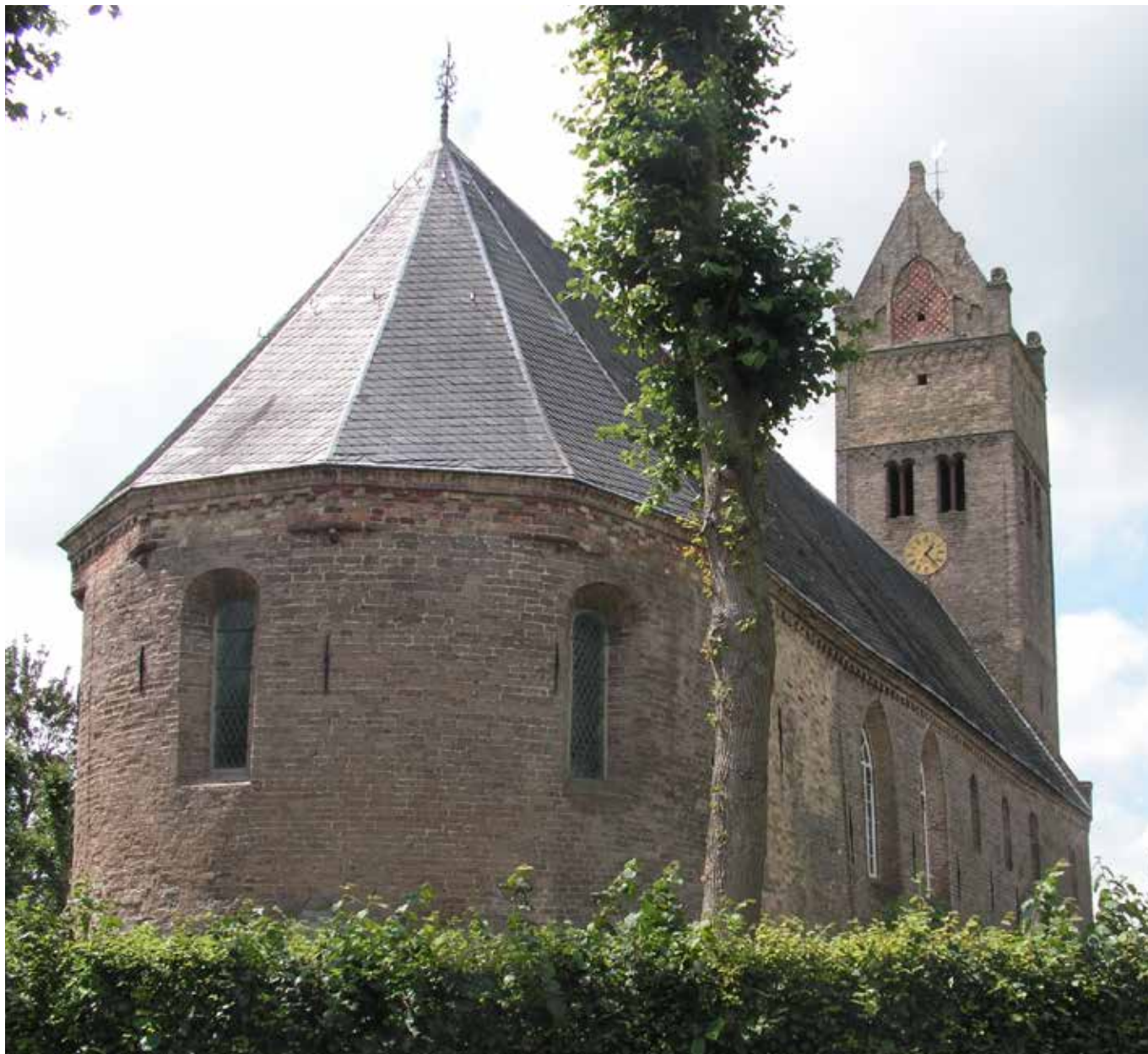
De kerk van Jorwerd