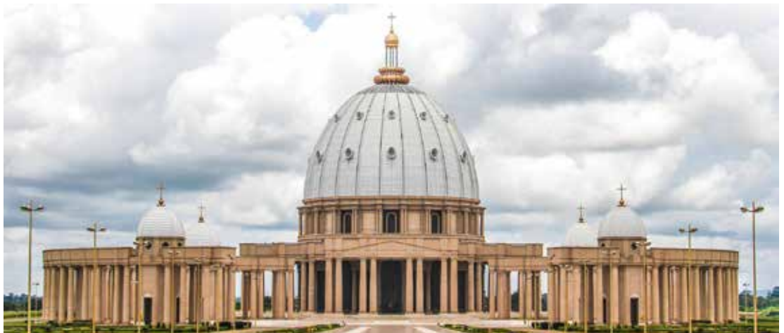
Basilique de Notre Dame de la Paix de Yamoussoukro

De synode heeft het rapport 'Waar een Woord is, is een weg' unaniem aanvaard. Dat heeft nieuwe uitgangspunten gecreëerd. Wij hebben gezegd: ondanks vragen gaan we niet in de contramine, maar we denken mee, waarbij het versterken van plaatselijke gemeenten, en 'local ownership' ijkpunten zijn en blijven. Vanuit de VKB zijn er gesprekken met de leiders van onze kerk. We herkennen dat we verschillende invalshoeken kunnen hebben, maar ook een gemeenschappelijk belang. Toch blijven we ook bezorgd over een te grote top down benadering. Hoe komen we tot een gezamenlijke koepel ten behoeve van niet-commerciële ondersteuning van plaatselijke kerken in beheerszaken? We willen één administratief loket, door de kerk gelegitimeerd. Maar ook beschikbaarheid van kerngegevens om per regio pro-actief beleid te kunnen maken, in gezamenlijkheid. De kerk gaat uit van terugbrengen van eigen inzet, en wil uitgaan van ondersteuning 'vrijwillig waar kan, betaald waar het niet anders kan'. Wij willen daarmee verder, stappen zetten. Wegen aanleggen waarop niemand gaan wil of gaan kan, heeft echter geen zin. We zoeken samen naar een begaanbare weg, naar een 'eeuwige weg' (Psalm 139:24). Dat wil zeggen: een weg die ons tot onze bestemming meevoert: er te kunnen zijn tot eer van God, ook als (kleinere) kerk in Nederland in de 21e eeuw.