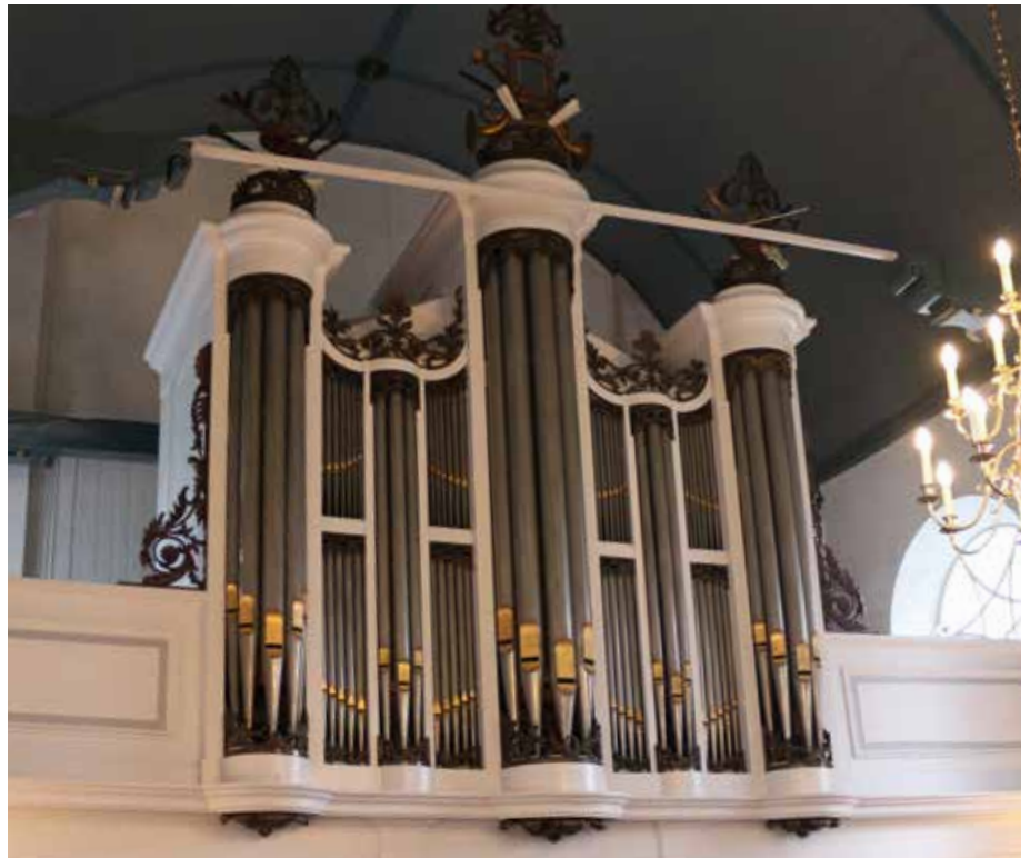
Het gerestaureerde orgel in de Dorpskerk van Huizum

De kerk uit de twaalfde eeuw wordt beheerd door een plaatselijke