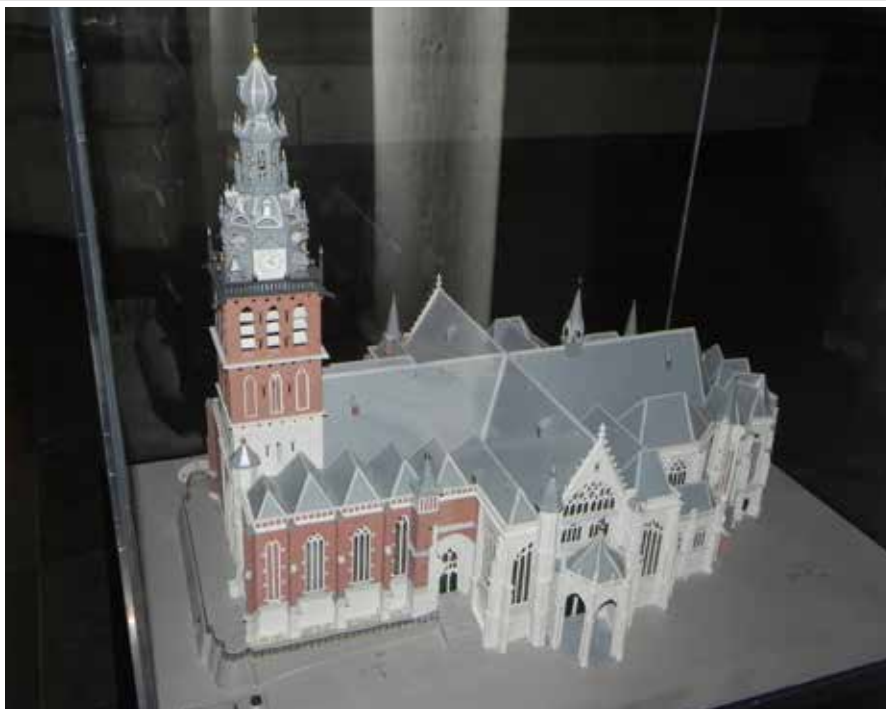
Maquette van de St. Stevenskerk Nijmegen