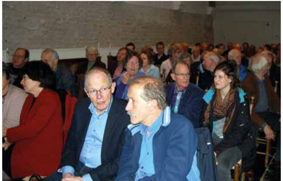
Aanwezigen in de kerk van Jorwerd

Met dit project zal het kerkinterieur in één klap zijn traditionele achterstand inlopen en staat het interieur