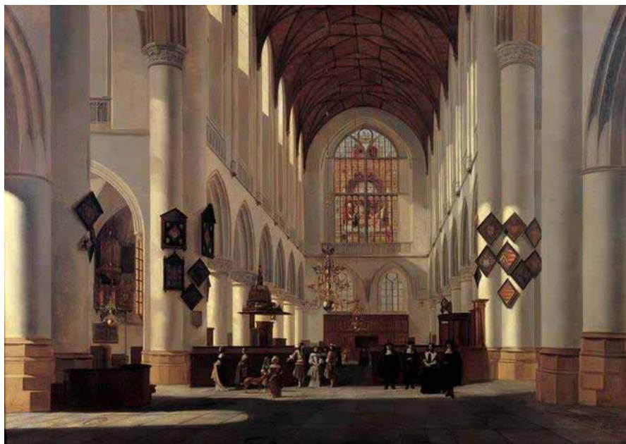
Job Adriaensz. Berckheyde, 'Interieur van de Grote of Sint-Bavokerk'